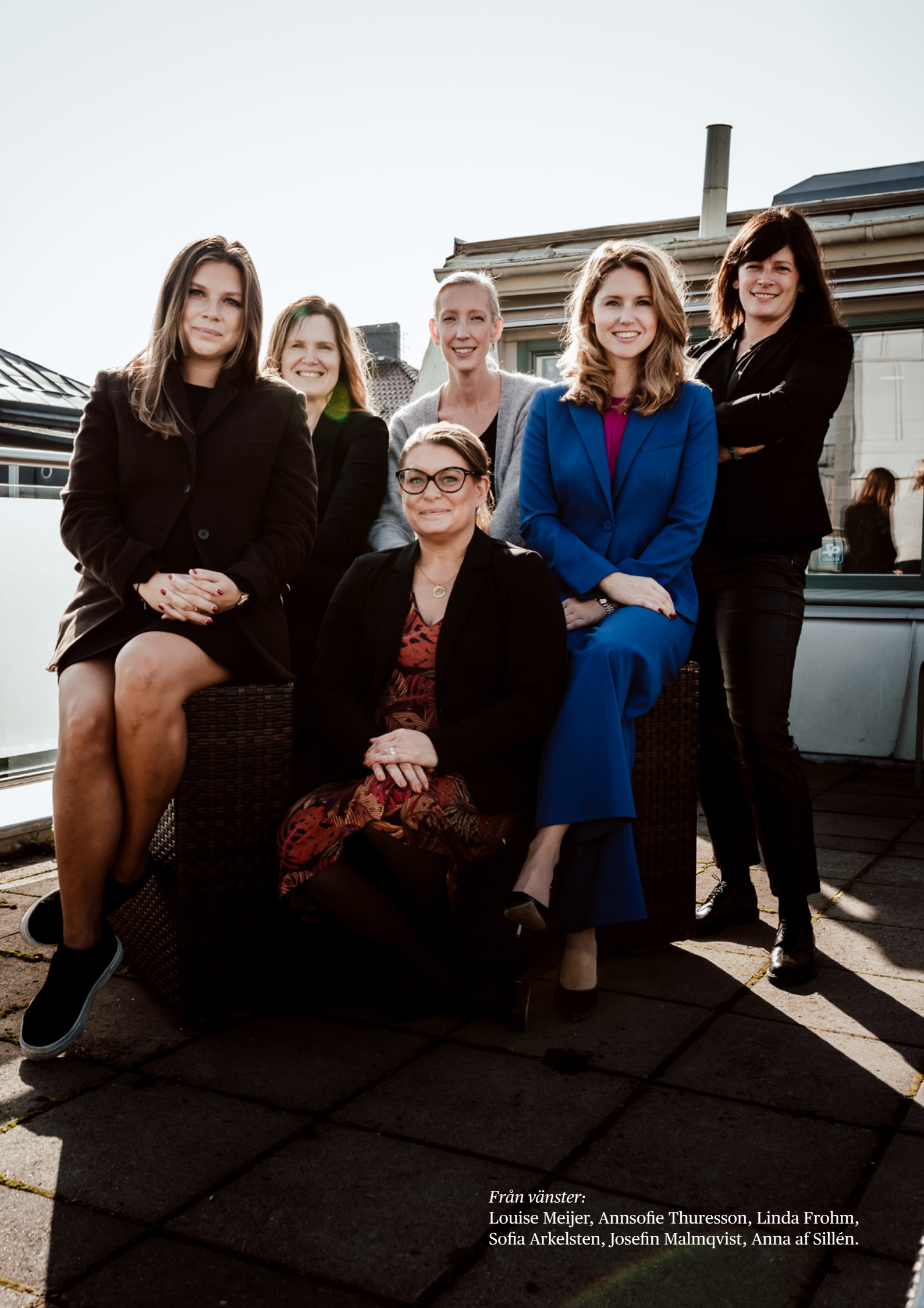
Från vänster: Louise Meijer, Annsofie Thuresson, Linda Frohm, Sofia Arkelsten, Josefin Malmqvist, Anna af Sillén.