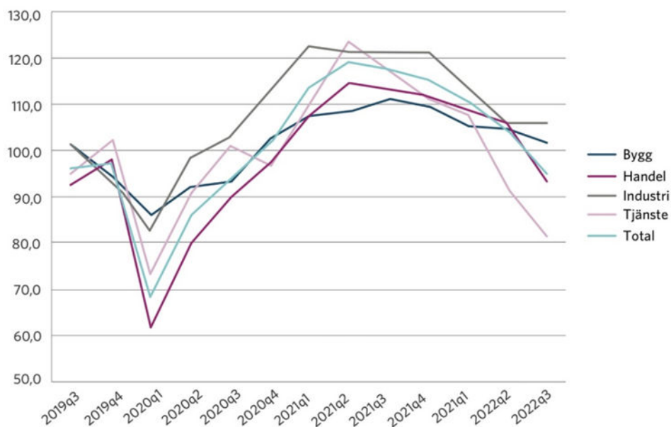
Figur 1. Konfidensindikatorn för näringslivet i Västerbotten har försvagats under 2022 i linje med övriga län och riket. Konfidensindikatorn tas fram genom en företagsenkät och mäter nuläget i näringslivet samt hur företagen ser på den närmaste framtiden (källa Norrlandsfondens konjunkturbarometer nov 2022)

Umeås näringsliv karaktäriseras av en väldigt stor branschbredd och en diversifiering med en tredjedel anställda inom tillverkande industri, företagstjänster samt platstjänster. Det har tidigare inneburit att Umeå klarat konjunktursvängningar betydligt bättre än de flesta andra platser. Till det kommer också det stora inslaget av offentliga arbetstillfällen som är mindre känsliga för skiftningar i konjunkturen.